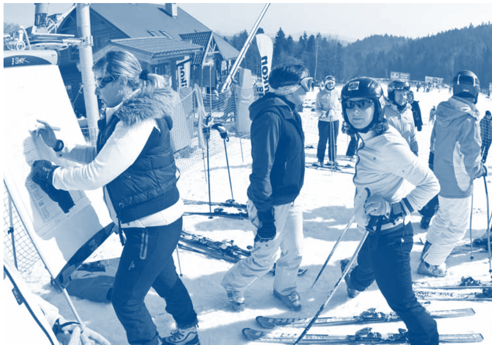
VIII Ogólnopolskie Mistrzostwa Narciarskie Radców Prawnych i Aplikantów