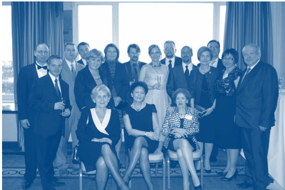
Uczestnicy obchodów 25-lecia EAL.

Uczestnictwo w konferencji pozwoliło na wzbogacenie wiedzy o doświadczenia prawników z innych krajów europejskich w zakresie restrukturyzacji przedsiębiorstw, problemów forum shopping oraz ochrony praw wierzycieli w postępowaniach prowadzonych przed obcymi sądami. Było również okazją do omówienia z przedstawicielem Komisji Europejskiej planów nowelizacji Rozporządzenia.