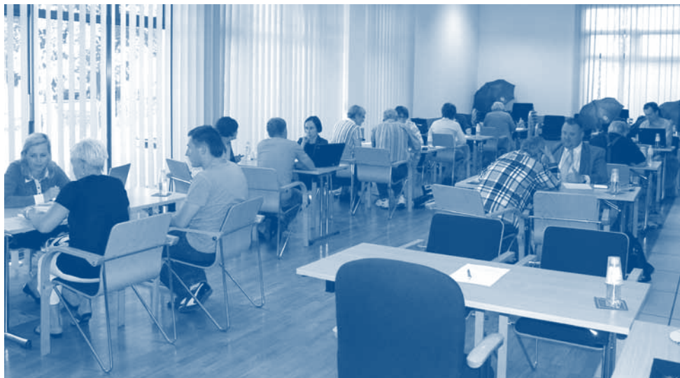
Sukces Akcji „Niebieski Parasol”

na sali przebywało 3-6 radców gotowych do udzielenia bezpłatnych informacji prawnych.