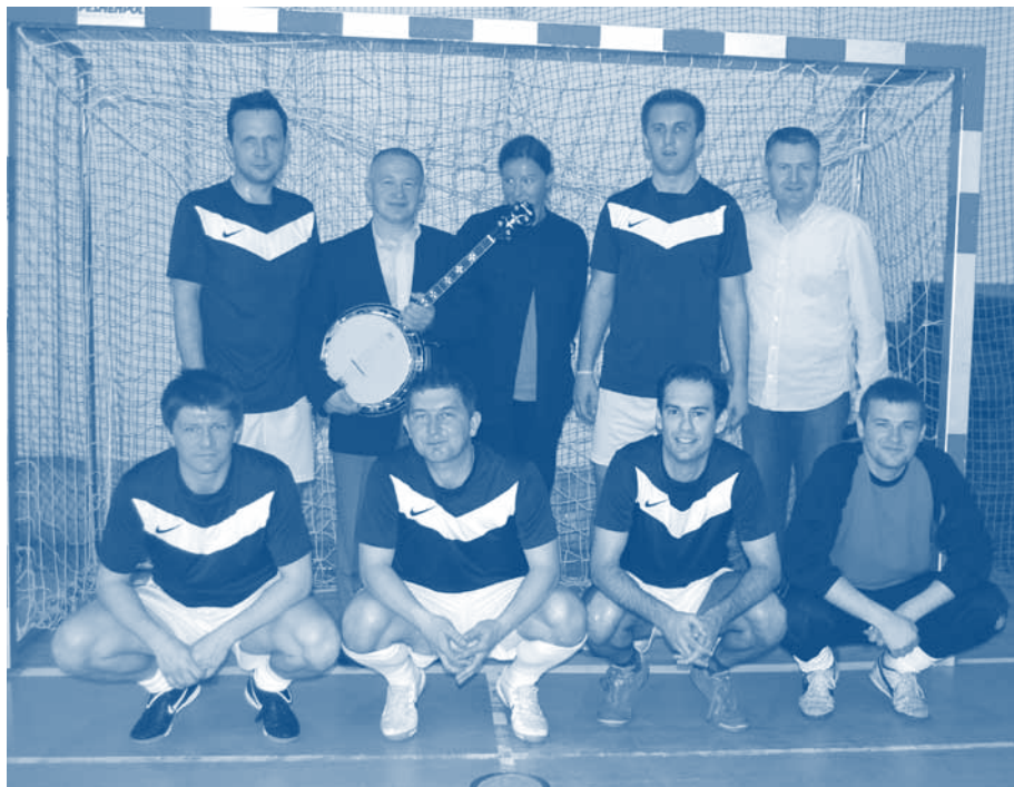
Krakowska drużyna ze swoimi kibicami

O ile więc nie udało się powtórzyć sukcesu sportowego sprzed roku, to poziom zaprezentowany przez kibiców już przeszedł do legendy rozgrywek. Nie można nie wspomnieć również o coraz lepszej organizacji turnieju oraz podnoszeniu poziomu imprez towarzyszących turniejowi, które nie mniej niż rywalizacja sportowa, przykuwają uwagę zawodników.